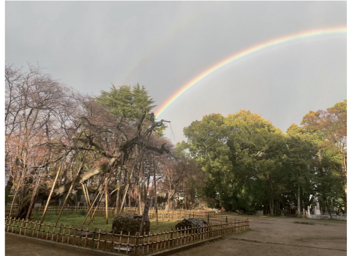
今年は桜の開花が遅く、掲載が間に合いませんでした。上写真は偶然撮影した 本山 弘法寺の開花前の枝垂れ桜と虹のコラボレーションです。